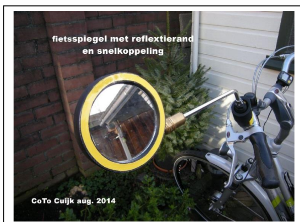
< Afb. 5

Daarvoor is een reflecterende rand voorzien terwijl aan de achterkant van de spiegel uiteraard ook een kleine reflector wenselijk is. Zie afbeelding 5 en 6